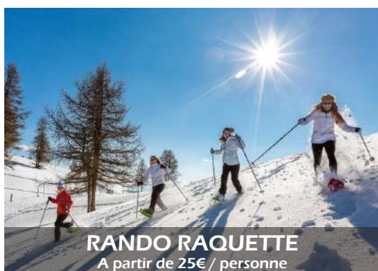
RANDO RAQUETTE A partir de 25€/ personne

Découvrez les paysages enneigés autrement avec les balades en raquette. Que ce soit pendant un séjour au ski ou loin des stations et de la population.