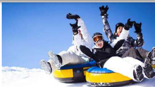
WINTERPARC A partir de 30 €/ personne

A Orcières 1850, 3 pistes dédiées à la descente en bouée s'offrent à vous avec des pentes plus ou moins impressionnantes pour des descentes complètement folles de 15 à 50km/h sur la neige.