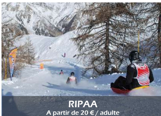
RIPAA A partir de 20 €/ adulte