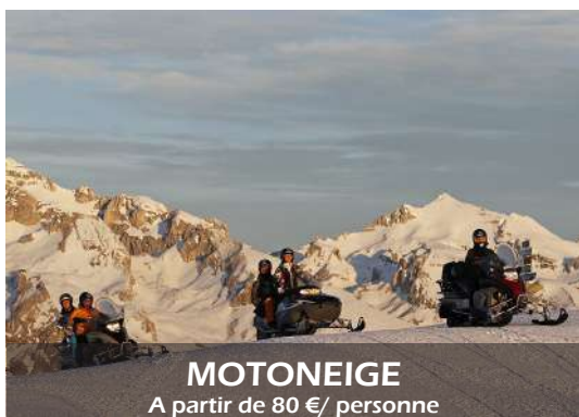
MOTONEIGE A partir de 80 €/ personne

Balades randonnées en motoneige sur des itinéraires variés et adaptés à tous les niveaux.